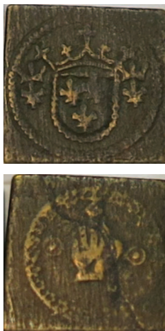
1 Ecu - (1519 - 1540) - goud - 3,44 g - Frankrijk 4434