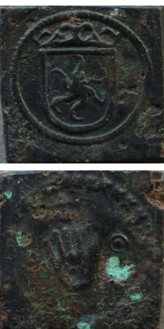
1 Ecu - (1519 - 1540) - goud - 3,44 g - Frankrijk 1496 2,89 g