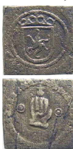
1 Ecu - (1475 - 1515) - goud - 3,50 g - Frankrijk 10746