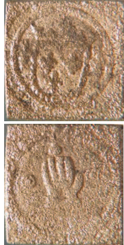
1 Ecu - (1519 - 1540) - goud - 3,44 g - Frankrijk 10556