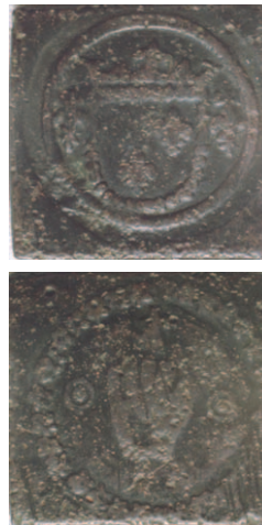
1/2 Ecu - (1475 - 1515) - goud - 1,75 g - Frankrijk 13536 1,191 g