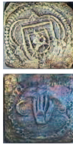
1 Postulaatgulden - (1423 - 1455) - goud - 3,2 g – Nederlanden