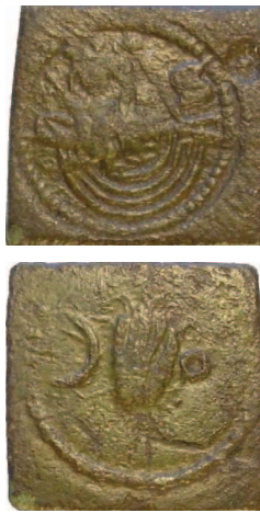
1 Postulaatgulden - (1423 - 1455) - goud - 3,2 g – Nederlanden