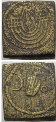
1/2 Noble - (1428 - 1585) - goud - 3,40 g – Engeland