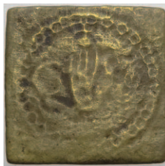
1 Vlies / Gouden vlies - (1496 - 1499) - goud - 4,49 g – Nederlanden