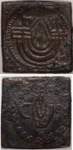
1 Noble - (1416 - 1585) - goud - 6,80 g – Engeland