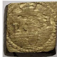
1/2 Pound - (1619 - 1660) - goud - 4,55 g - Engeland