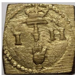
1 Pound - (1604 - 1606) - goud - 10,04 g - Engeland