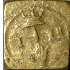
1 Fiorino di camera / Scudo - (1533 - 1735) - goud - 3,39 g - Italië