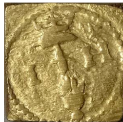
1 Pound - (1670 - 1813) - goud - 8,39 g - Engeland