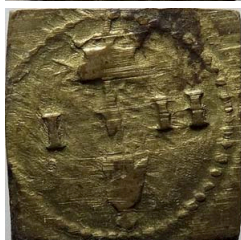
1/4 Pound - (1604 - 1619) - goud - 2,51 g - Engeland