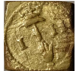
1/2 Pound - (1670 - 1813) - goud - 4,19 g - Engeland