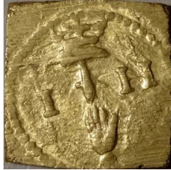
2 Excelente - (1581 - 1601) - goud - 7,01 g - Spanje