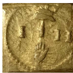
2 Forint - (1612 - 1805) - NIET - 7,01 g - Hongarije