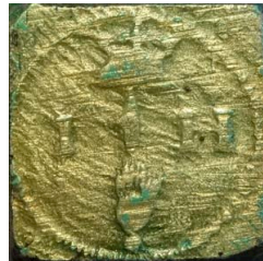
1 Pound - (1619 - 1660) - goud - 9,10 g - Engeland