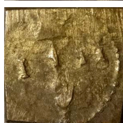
1 Reaal / Keizers-reaal / Konings-reaal - (1521 - 1598) - goud - 5,32 g - Nederlanden