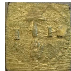
1/2 Rider / Sword and sceptre - (1593 - 1604) - goud - 2,54 g - Schotland