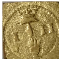
1 Rider / Sword and sceptre - (1593 - 1604) - goud - 5,09 g - Schotland