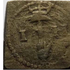
1 Forint - (1582 - 1808) - goud - 3,51 g - Hongarije