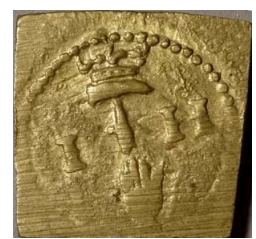
1 Kroon / Brabantse kroon - (1540 - 1657) - goud - 3,41 g - Nederlanden