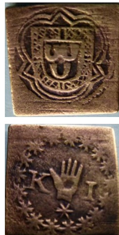
Horner-gulden - (1484 - 1505) - goud - 2,4 g – Nederlanden