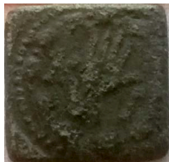
1 Ecu - (1475 - 1515) - goud - 3,50 g - Frankrijk