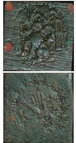
1 Leeuw - (1454 - 1460) - goud - 4,25 g – Nederlanden