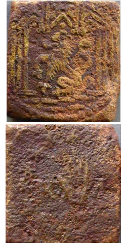
1 Leeuw - (1454 - 1460) - goud - 4,25 g – Nederlanden