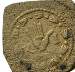
1 Ecu - (1475 - 1515) - goud - 3,50 g - Frankrijk