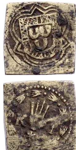
1 Leeuw - (1454 - 1460) - goud - 4,25 g – Nederlanden