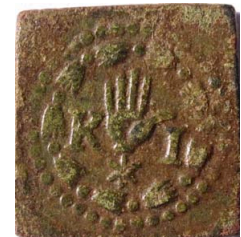
1 Ecu - (1519 - 1540) - goud - 3,44 g - Frankrijk