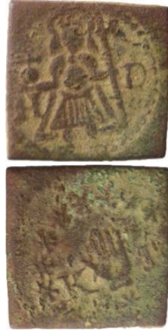
1 Forint - (1527 - 1848) - goud - 3,49 g – Hongarije