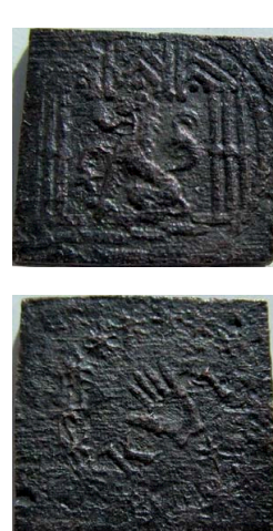
(nieuwe) Andries-gulden - (1567 - 1570) - goud - 3,25 g – Nederlanden