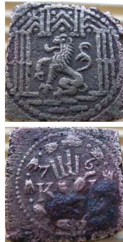
2/3 Leeuw - (1454 - 1455) - goud - 2,84 g – Nederlanden