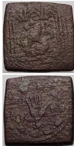
1 Leeuw - (1454 - 1460) - goud - 4,25 g – Nederlanden