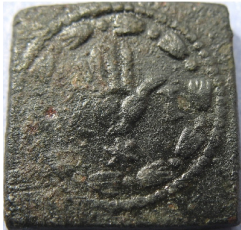
1 Clemmergulden / Klemmer-gulden - (1492 - 1543) - goud - 3,24 g - Nederlanden