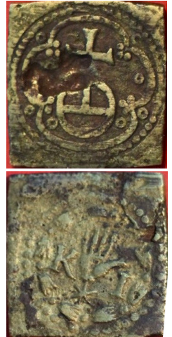
Goldgulden - (1559 - 1806) - goud - 3,25 g – Duitse Rijk