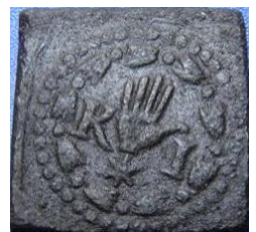
1 Ecu - (1475 - 1515) - goud - 3,50 g - Frankrijk