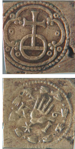
Horner-gulden - (1484 - 1505) - goud - 2,4 g – Nederlanden