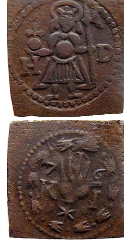
Goldgulden - (1559 - 1806) - goud - 3,25 g – Duitse Rijk