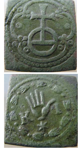
Goldgulden - (1559 - 1806) - goud - 3,25 g – Duitse Rijk