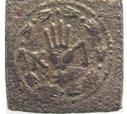
1 Cruzado - (1555 - 1583) - goud - 3,82 g - Portugal