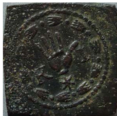
1 Ecu - (1519 - 1540) - goud - 3,44 g - Frankrijk