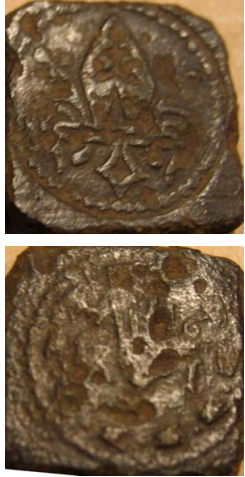
1 Forint - (1527 - 1848) - goud - 3,49 g – Hongarije