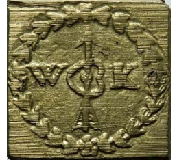
1 Cruzado - (1584 - 1671) - goud - 3,06 g - Portugal