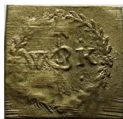
4 Escudo - (1566 - 1821) - goud - 13,52 g - Spanje