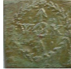
1/2 Reaal / Keizers-reaal / Konings-reaal - (1521 - 1598) - goud - 3,50 g – Nederlanden