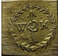
1/2 Ecu - (1610 - 1643) - goud - 1,67 g - Frankrijk