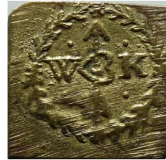
1/4 Pound - (1619 - 1660) - goud - 2,27 g – Engeland