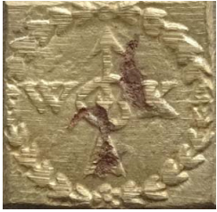
2 Cruzado - (1584 - 1674) - goud - 6,12 g - Portugal