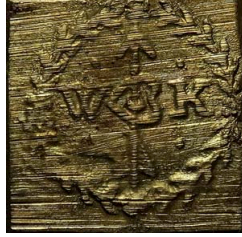
1 Cruzado - (1538 - 1555) - goud - 3,57 g - Portugal