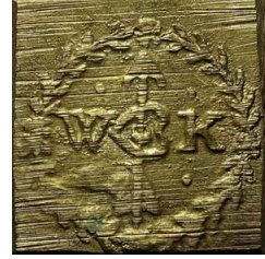
1 Cruzado - (1584 - 1671) - goud - 3,06 g - Portugal