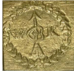
1/4 Pound - (1604 - 1619) - goud - 2,51 g – Engeland