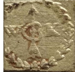
1 Rijder / Hollandse rijder - (1606 - 1765) - goud - 10,00 g – Nederlanden