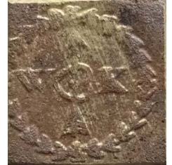
1 Rider / Sword and sceptre - (1593 - 1604) - goud - 5,09 g – Schotland