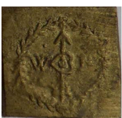
1 Cruzado - (1584 - 1671) - goud - 3,06 g - Portugal