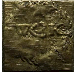
1 Dinar - (1130 - 1655) - goud - 2,3 g - Marokko