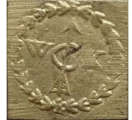
1/4 Pound - (1619 - 1660) - goud - 2,27 g – Engeland