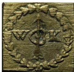
2 Dinar - (1230 - 1655) - goud - 4,6 g - Marokko