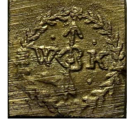
1 Rider / Sword and sceptre - (1593 - 1604) - goud - 5,09 g – Schotland