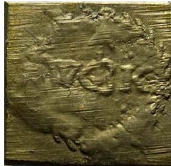
2 Dinar - (1230 - 1655) - goud - 4,6 g - Marokko