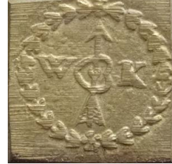
1 Provinciale rijder - (1582 - 1599) - goud - 3,41 g – Nederlanden