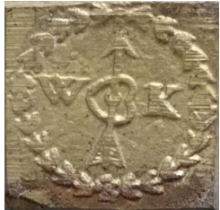
1/4 Pound - (1544 - 1549) - goud - 3,11 g – Engeland