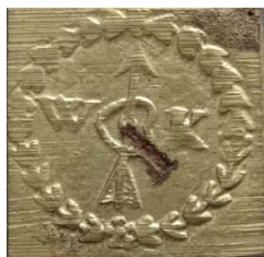
1/2 Ecu - (1610 - 1643) - goud - 1,67 g - Frankrijk