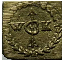
1 Rijder / Hollandse rijder - (1606 - 1765) - goud - 10,00 g – Nederlanden