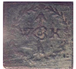
1 Ecu - (1610 - 1645) - goud - 3,35 g - Frankrijk