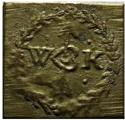
1 Provinciale rijder - (1582 - 1599) - goud - 3,41 g – Nederlanden