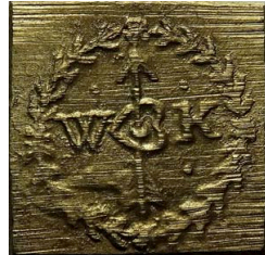
1/2 Rider / Sword and sceptre - (1593 - 1604) - goud - 2,54 g – Schotland