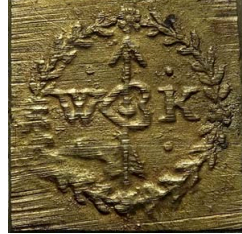
1 Reaal / Keizers-reaal / Konings-reaal - (1521 - 1598) - goud - 5,32 g – Nederlanden