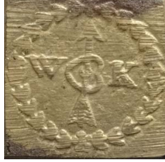
1 Cruzado - (1538 - 1555) - goud - 3,57 g - Portugal