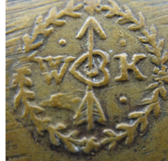
1/4 Pound - (1604 - 1619) - goud - 2,51 g – Engeland