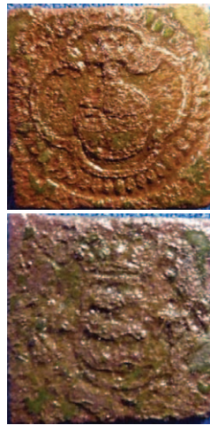
1 Leeuw - (1583 - 1584) - goud - 4,14 g - Nederlanden