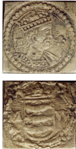
1 Ryal - (1464 - 1592) - goud - 7,78 g - Engeland