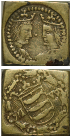
1 Forint - (1582 - 1808) - goud - 3,51 g - Hongarije