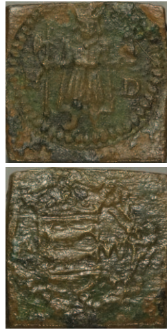
Goldgulden - (1559 - 1806) - goud - 3,25 g - Duitse Rijk