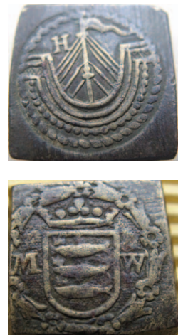
1/2 Noble - (1428 - 1585) - goud - 3,40 g - Engeland