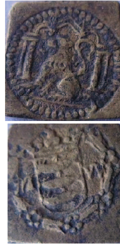
1 Noble - (1416 - 1585) - goud - 6,80 g - Engeland