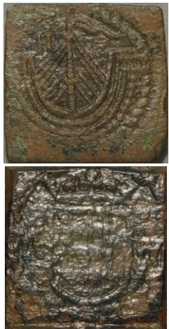
1 Pound - (1551 - 1602) - goud - 11,27 g - Engeland