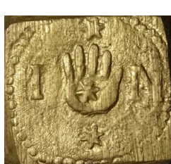
1 Louis - (1726 - 1785) - goud - 8,16 g – Frankrijk