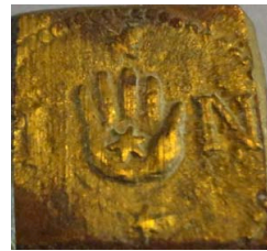
1 Louis - (1717 - 1718) - goud - 6,12 g – Frankrijk