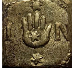
1 Louis - (1717 - 1718) - goud - 6,12 g – Frankrijk