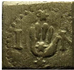
1 Louis - (1717 - 1718) - goud - 6,12 g – Frankrijk