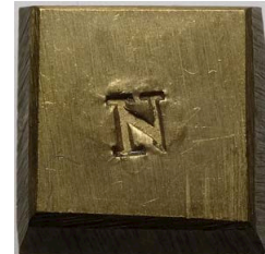
1/2 Louis - (1709 - 1715) - goud - 4,06 g – Frankrijk