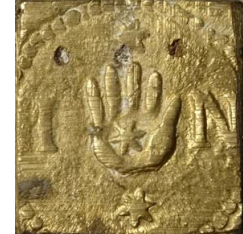
1 Louis - (1723 - 1725) - goud - 6,53 g – Frankrijk