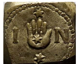
1 Louis - (1723 - 1725) - goud - 6,53 g – Frankrijk