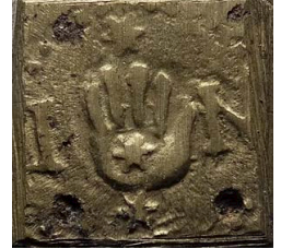
1 Louis - (1718 - 1723) - goud - 9,79 g – Frankrijk