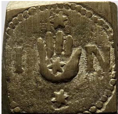
1 Louis - (1718 - 1723) - goud - 9,79 g – Frankrijk