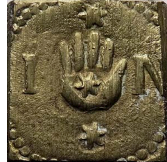
1 Louis - (1723 - 1725) - goud - 6,53 g – Frankrijk