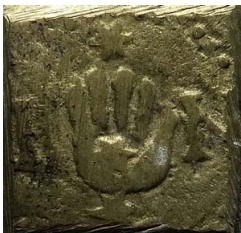
1 Louis - (1726 - 1785) - goud - 8,16 g – Frankrijk