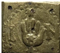
1 Louis - (1723 - 1725) - goud - 6,53 g – Frankrijk