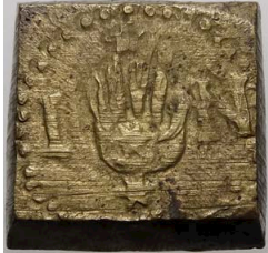
1 Louis - (1709 - 1715) - goud - 8,13 g – Frankrijk