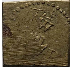
1/2 Louis - (1720 - 1723) - goud - 4,89 g – Frankrijk